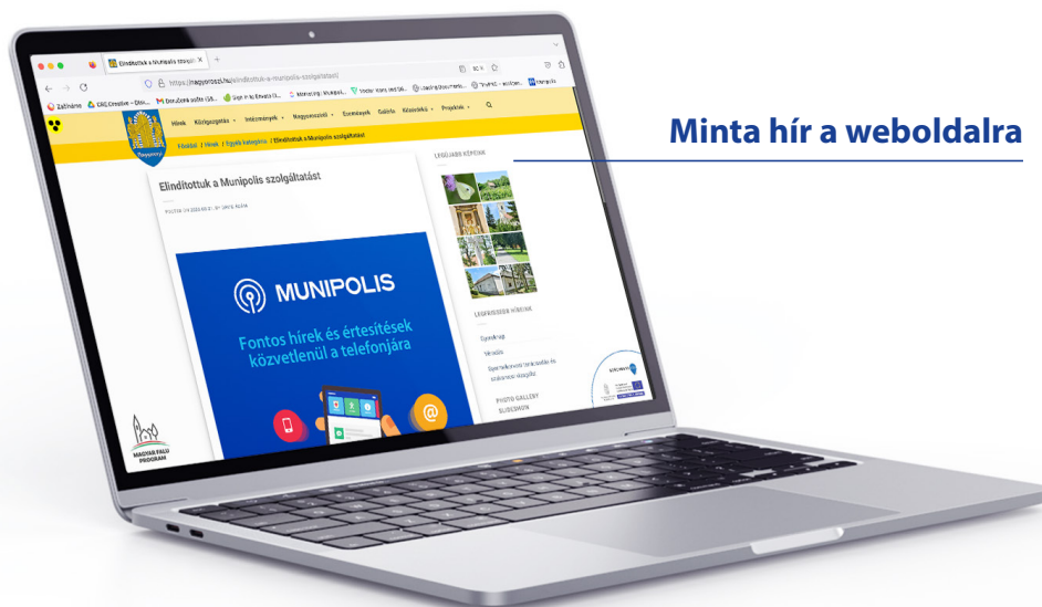
Minta hír a weboldalra

Tekintse meg, hogy a már résztvevő önkormányzatok hogyan osztják meg híreiket.